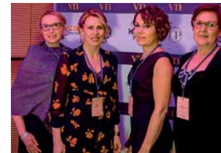
Yllä tapahtuman taustalla ollut naisten tehotiimi. Tilaisuuden järjestäjät olivat KIP:n alueen yrityksistä. Muissa kuvissa osallistujien tunnelmia.