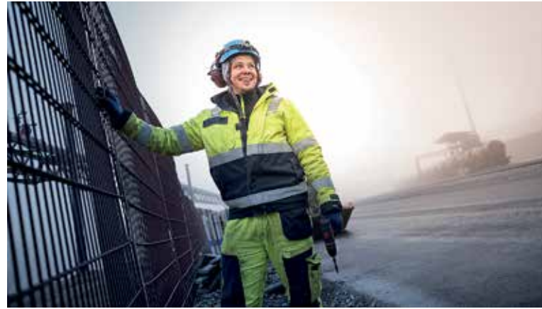
Markkinoinnin avulla houkuteltaan myös tulevaisuuden osaajia töihin KIP:n alueelle.