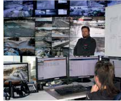
Port Towerin valvomon monista näytöistä seurataan koko Suurteollisuusalueetta ympäri vuorokauden.

- Päätehtävämme on tietää aina ketä alueella on. Evakuointitilanteessa tulee olla tiedossa kokonaishenkilömäärä, Känssä kertoo. ✕