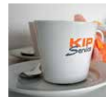
Alueelta löytyy useita uudistettuja kokoustiloja.