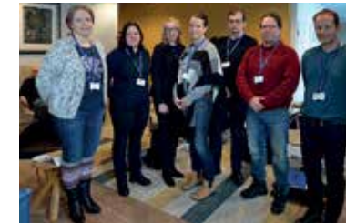
KIP ja AIP ympäristöryhmät yhteisessä tapaamisessa.