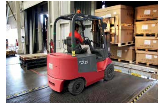
Olennaista on, osaako kuljettaja ajaa trukkeja uudessa työpaikassa uusissa oloissa, ja mahdollisesti myös uudella kalustolla.